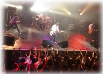
高校生バンドステージ