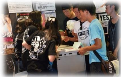
高校生スタッフによる受付風景