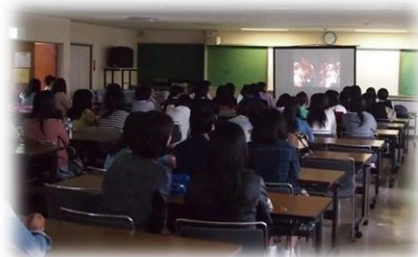
決起集会風景 (4月末日)