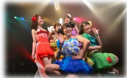
Hair & Makeステージ