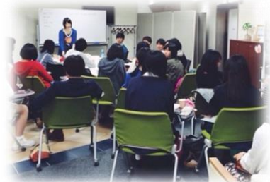
高校生幹部スタッフミーティング風景