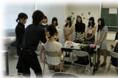
理容美容専門学校での研修風景