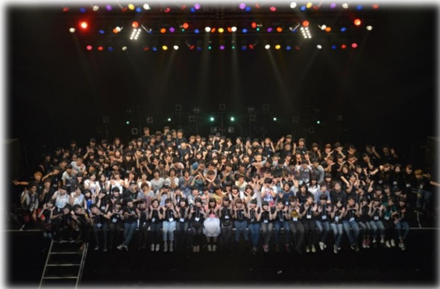
全高校生スタッフ約200名